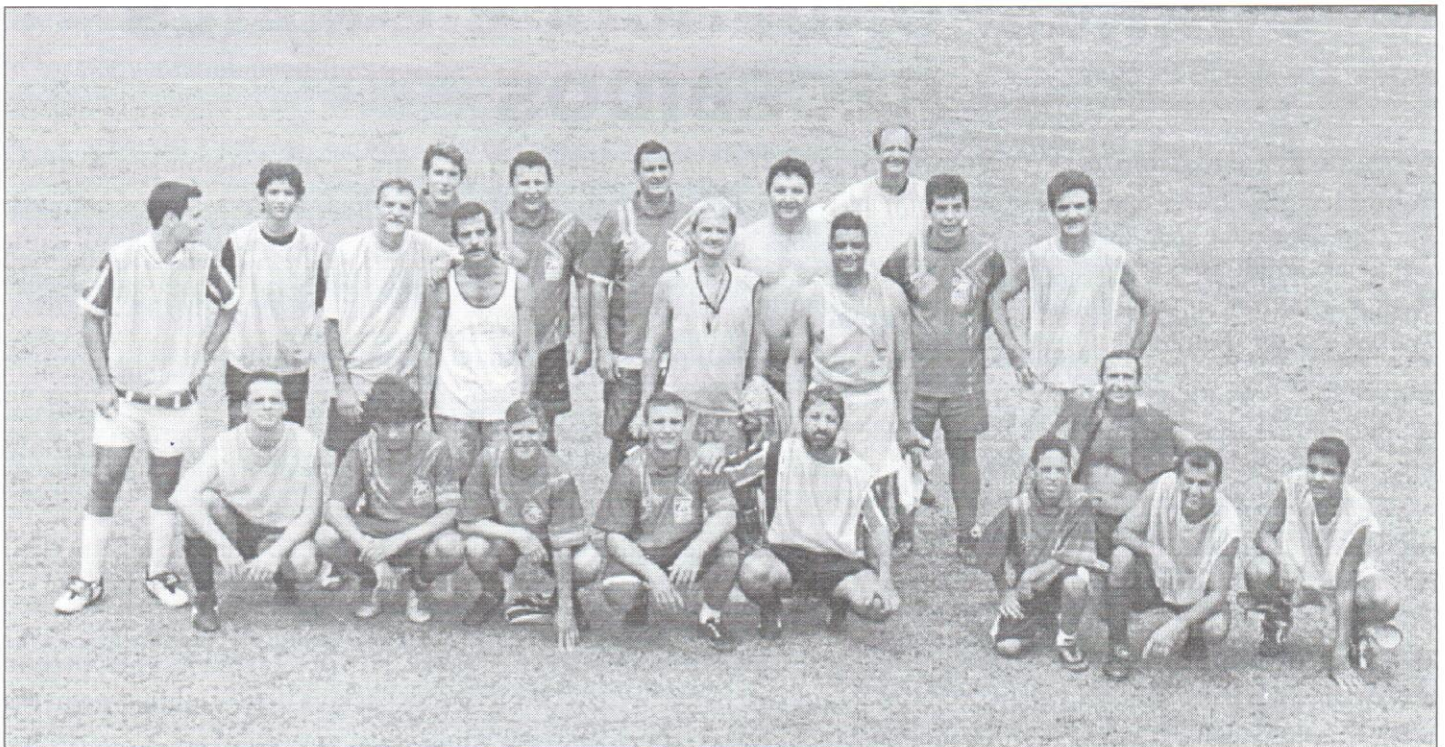
Craques do Ibaté, em momento de concentração...

Obrigado a todos os que compareceram, fúnebres pêsames a quem não foi, e uma recomendação sincera de uma amigo: NÃO PERCAM A PRÓXIMA!