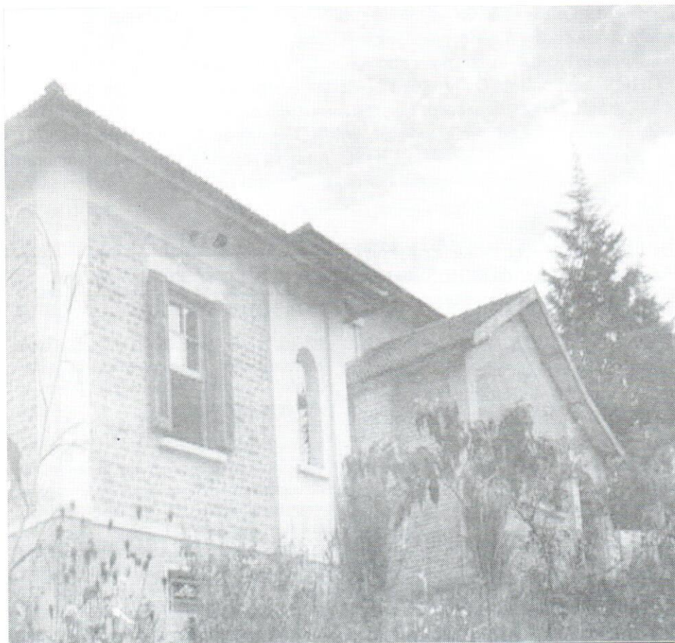
Casa das Irmãs - vista lateral